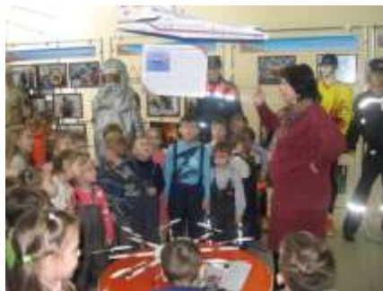
музей пожарной охраны